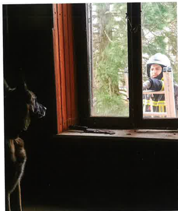
Manœuvre avec différents risques type animaliers