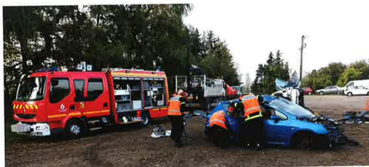
Manœuvres de secours routier